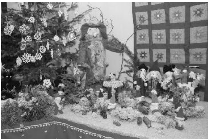
Käsitööringi liikmete fantaasial ei ole piire

Rapla koguduse käsitööringi naised-noorikud olid seekordseks jõulumüügiks valmistudes jälle töökad olnud: mütsid-sallid, kindad-sokid, vaibad-padjad-linikud, põlled-kotid, mänguasjad ja muud esemed, mis majapidamisse sobivad, ootasid ostjaid. Valik oli suur. Aga kas rahvast tuleb? Oli ju paar päeva enne kultuurimajas olnud uhke ja rikkalike kaubalettidega jõululaat.