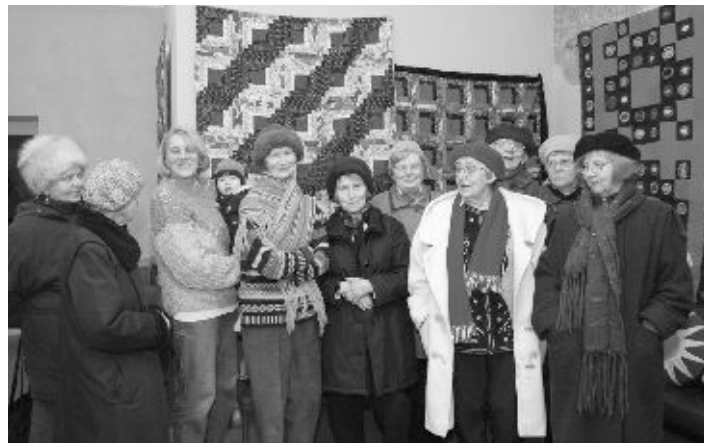
Rahulolevad naised pärast näituse ülessaamist