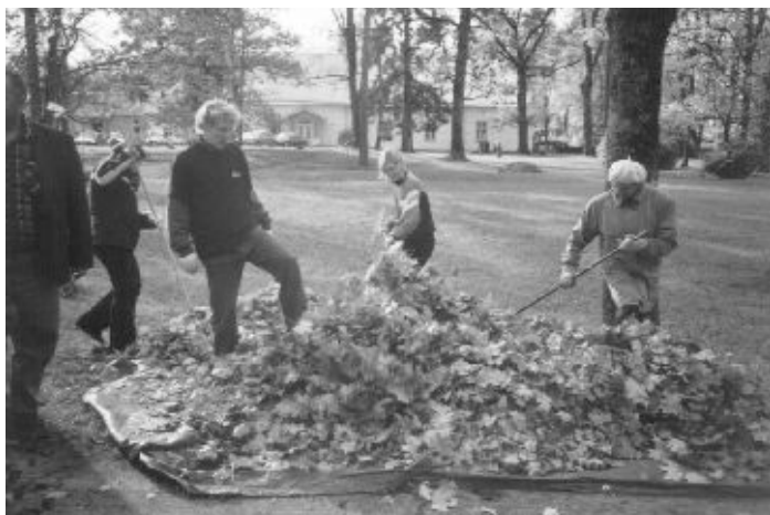
Sügisel koristuspäeval kirikupargis oli hulk abilisi

25.09. Rapla kiriku 104.aastapäeval jutlustas Rannamõisa