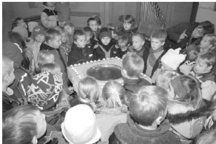
Rapla lasteaedade lapsed hingedepäeval kirikus

2.11. Hingedepäeval oli kirik avatud palveks, mõtiskluseks ja küünla süütamiseks. Rapla lasteaedade lastele korraldati ühiskülastus kirikusse.