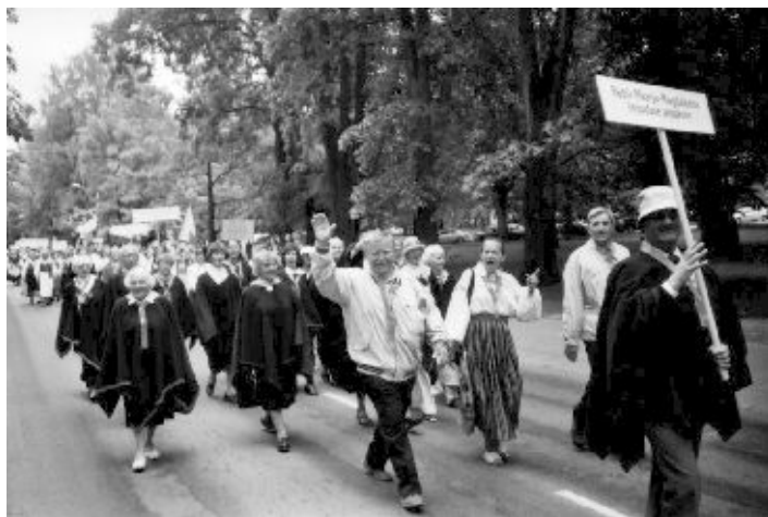
Koguduse segakoor Tartu laulupäeva rongkäigus

10.-11.06. EELK kirikupäev ja vaimulik laulupidu Tartus, millest võtsid osa ka Rapla koguduse koorid.