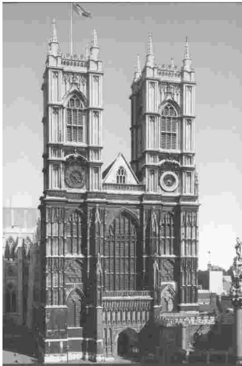
Westminster Abbey on Londoni kuulsaim kirik

rajatise, mille algne eesmärk ja isegi ehitajad on teadmata. Levinuim arvamus on, et Stonehenge ehitati 3100 aastat eKr. Salapära lisavad moodustisele rohked müüdid, mis räägivad võlur Merlini seotusest kiviringi ehitamisega. Teadlased kalduvad siiski arvama, et ehitise kõige esimene mõte oli olla inimestele kalendri eest. Tänapäeval on saanud sellest turismimagnet.