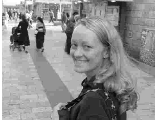
Aive Rahula Jeruusalemma tänaval

Kindlasti tahaksin ka tänava Iisraelis käia. Sinna jäi väga väga palju kalleid sõpru ja mu sealne kodukogudus Shemen Sasson (tõlkes rõõmuõli). Plaanin koos koguduse noortega minna mõnele suvisele festivalile, kus veel juudi noortega kontakte saada, neid kirikusse kutsuda. Tahan mõnest koguduse üritusest osa võtta, piiblikooli külastada ja puhata. Ma usun, et praegu on aeg, kus Jumal liidab oma maist ihu: nõ paganarahvaid ja juudikristlasi ja ma tahaksin kaasas olla Jumala ettevõtmistes.