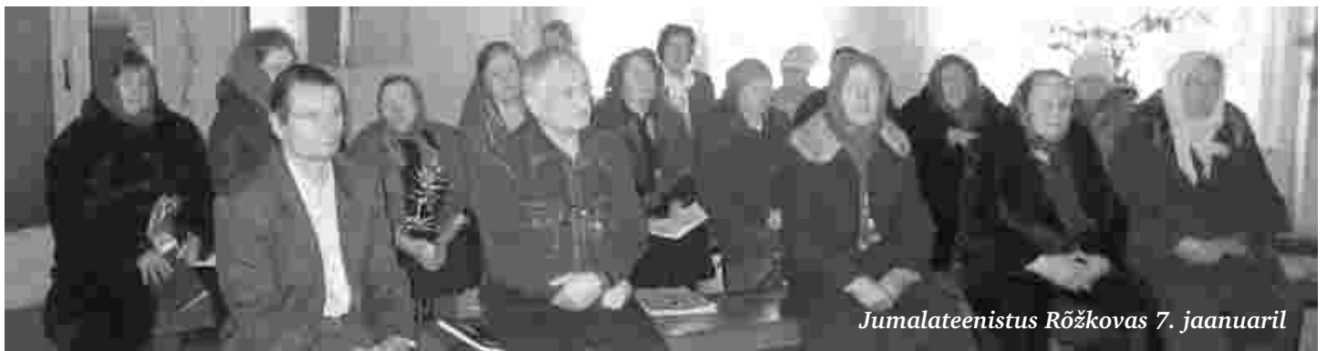
Jumalateenistus Rõžkovas 7. jaanuaril