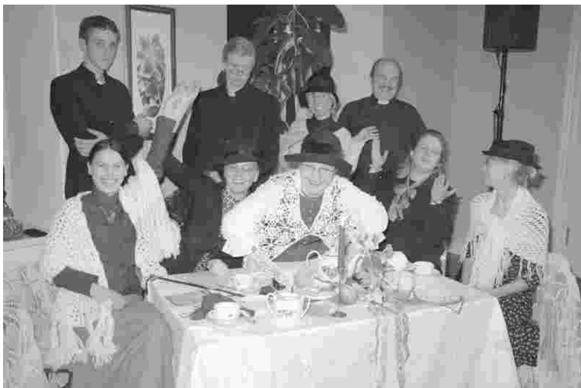
Kogu näitetrupp „Meie misjoni“ etenduse järel Rapla pastoraadis

Slaidiprogramm näis hea võimalusena etendust sisuliselt tihendada. Informatiivsus oli algusest peale põhitaotlus. See, et lõpptulemuses on paras annus koomikat, annab põhjust loota, et lugu on eluline. Kristlaste, eriti luterlaste kultuur on meil aja jooksul omandanud ebausutavalt tõsise värving.