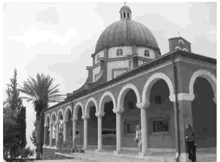
Mäejutluse kohale ehitatud õndsakskiitmiste kirik Galileas