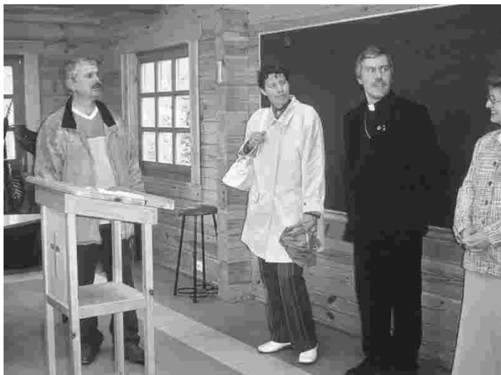
Koguduse rahvas tutvumas Lootuse küllaga Laitses