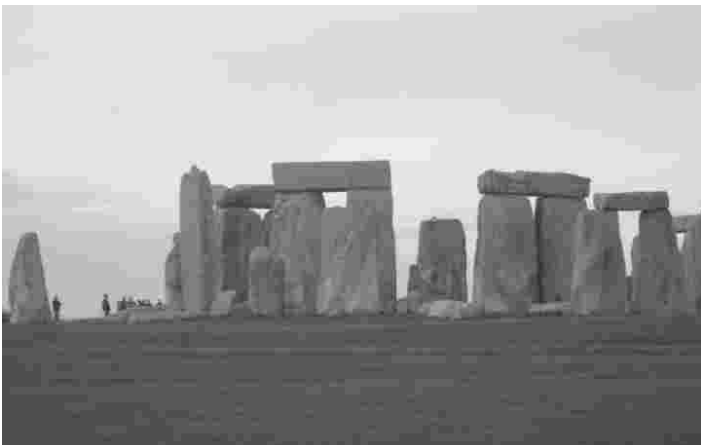
Stonehenge arvatakse pärinevat 3100 aastat eKr

Päeva teiseks tipphetkeks oli kuulsa Stonehenge'i kiviringi külastamine. Tegemist on suurtest kiviplokkidest moodustatud