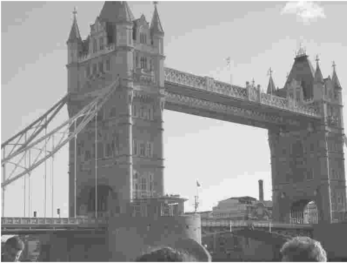
Tower Bridge on üks Suurbritannia pealinna sümboleid

Londonis ringi jalutades panin tähele, et tänavate äärtes polnud üldse prügikaste vältimaks terroristidel võimalust neisse pomme peita. Selline kaitsemeetod rakendati Londonis pärast möödunud aasta 11.märtsi Madriidi terroriakte.