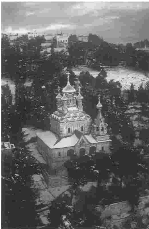
Maarja-Magdaleena õigeuskirik talvises Jeruusalemmas

Üldistatult võingi öelda, et õppisin Jumalat rohkem tundma,