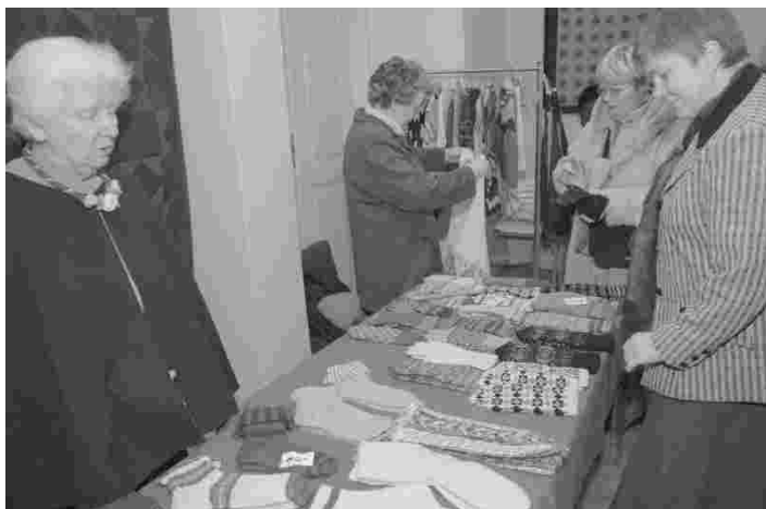
Hetk 2006. aasta jõulu käsitöö näitusmüügil