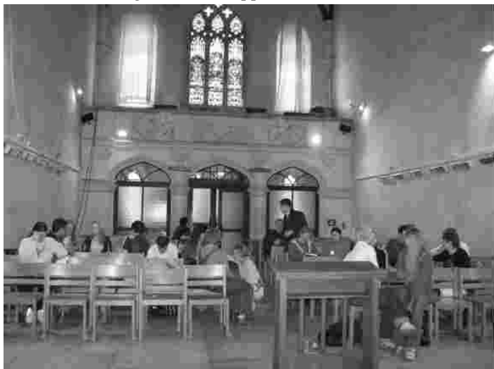
Õppetöö Jeruusalemma messiaanlikus ehk kristlike juutide kirikus

Enne suhtusin veidi üleolevalt sellesse, et ortodokssete juudid ei kasuta hingamispäeval elektritki. Mulle tundus see liigse käsumeelsusena. Aga Iisraelis elades kogesin, kui suur puhkus see on vaimule, hingele ja ihule, kui ma kogu ööpäeva ei vaata telekat, ei korista, ei pane pesumasinatki tööle... Selleks oli