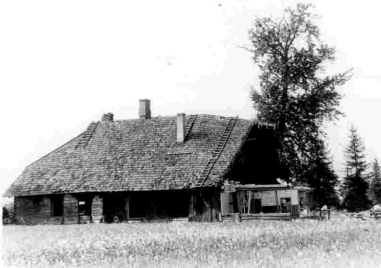
Rapla palvemaja lammutati aastal 1976

1994.aastal taastati ametlikult Eesti Evangeelne Vennastekogudus ning senist koguduse pietistlikku laadi tegevust oli põhjust taas selle õige nimega nimetada.