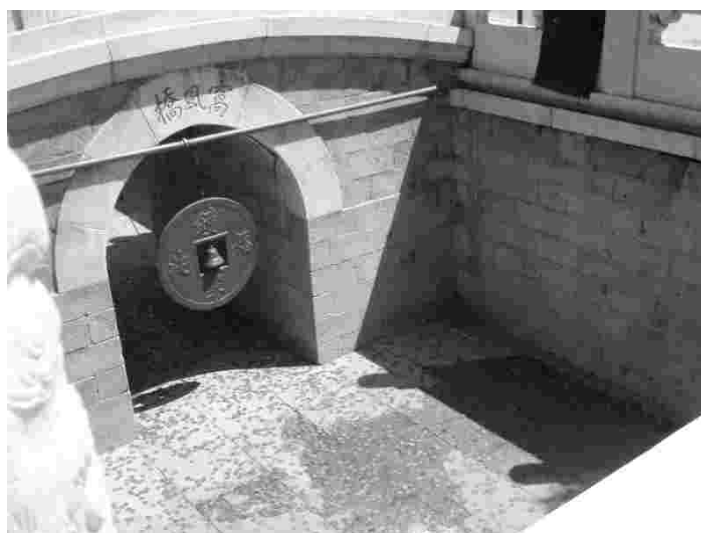
Önnekell taoistlikus templis Pekingis