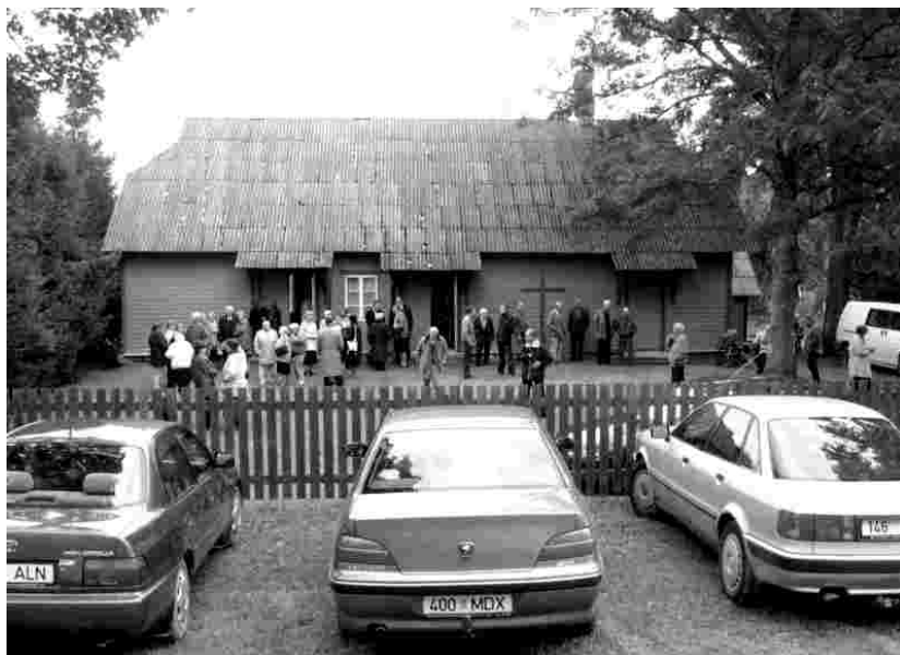
Aastapäev toob Nabala palvemaja juurde alati nii inimesi kui ka autosid