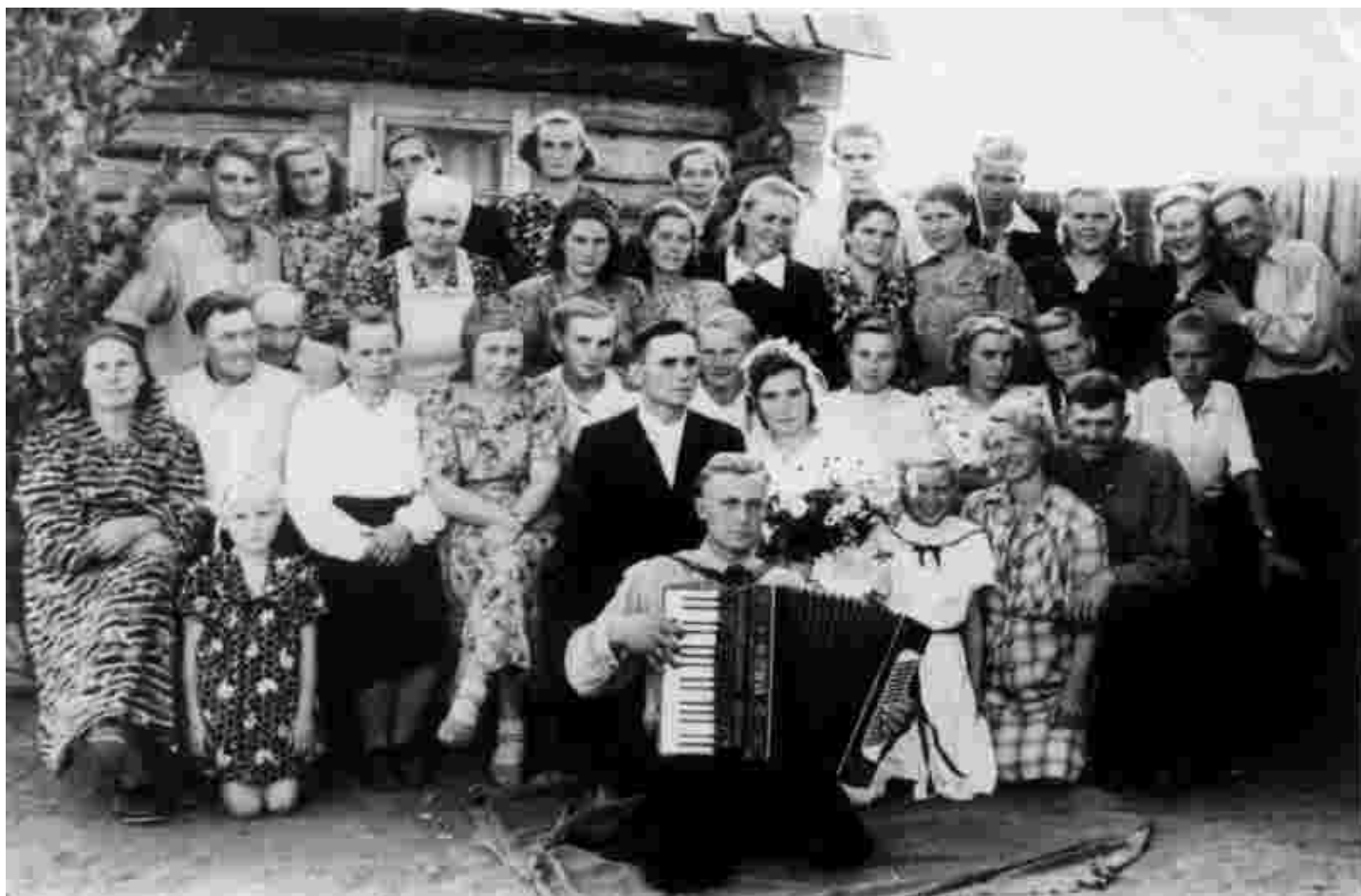
Pulmapidu peeti üheskoos Siberi eestlastega