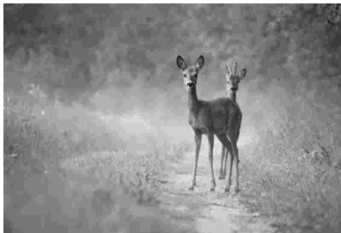
Madis Reimundi loodusfoto allkirjaga „Noorpaar“

Näituse pildid koosnevad erinevatest Eesti kohtadest, mis meile mingil määral südamelähedased on. Olgu see siis karges hommikuses udus olev raba või loksuv laine Saaremaal. Piltidega tahaksime anda mõista, et uuri enne oma koduümbrust, kui lähed avastama võõramaa radu.