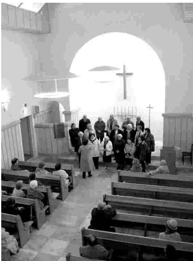
Rapla lauljad Nõmme Lunastaja kiriku akustikat proovimas