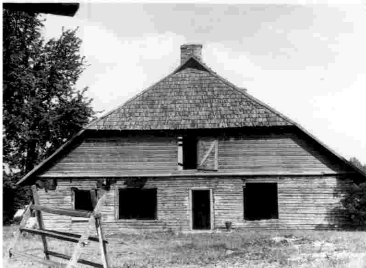
Rapla vennastekoguduse palvemaja enne lammutamist

Nõukogude ajal oli aga tavaline, et küsimuse otsustasid sageli kohalikud ülemused. Heaks näiteks on naaberkihelkond Hageri, kus mõlemad vennastekoguduse palvemajad, nii Hageris kui ka Saku-Tõdval, jäid tegutsema.