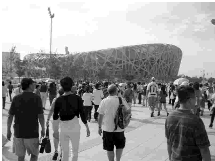
Linnupesaks ristitud Pekingi olümpiastaadion