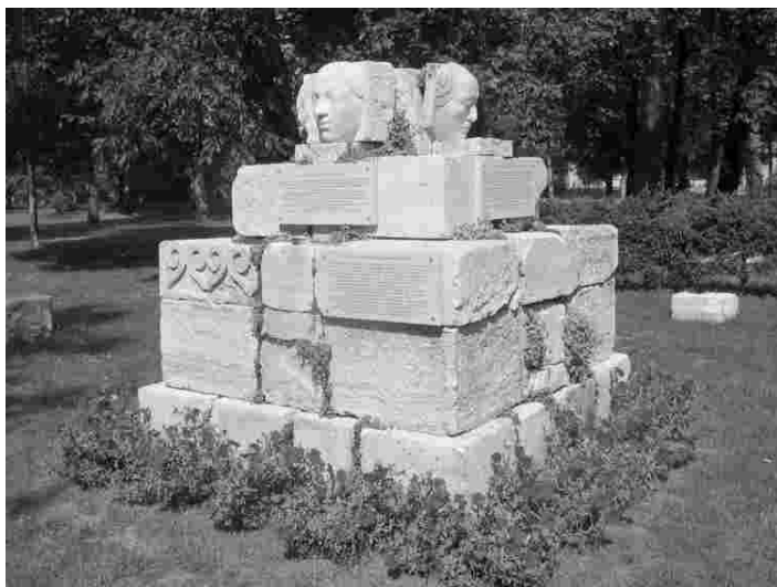
Vabadussõja ausamba tükkidest memoriaal Alu mõisa pargis