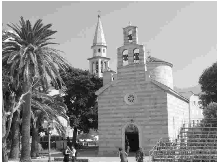
Imeilus õigeusu kirik Budva vanalinnas Montenegros

Seda, millised erinevused kunagise Jugoslaavia osariikide vahel tegelikult on, nägi näiteks läbi Dinaari mägede Montenegro poole sõites. Bosnias ja Hertsegoviinas ahenes rahvusvaheline maantee kohati ainult ühe sõidurea laiuseks, kuhu buss vaevu ära mahtus ning maksimaalne sõidukiirus ei tohtinud ületada 10 km tunnis. Montenegro piiri ületades pilt muutus oluliselt. Kuigi fantastilised mäed läksid ikka kõrgemaks ja nendevahelised kanjonid aina sügavamaks, läbisime kõige ohtlikumad kohad turvalistes tunnelites.