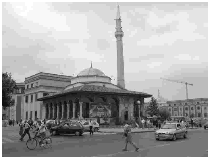
Kaunis mošee Tiranas, mis Enver Hoxa ajal muudeti tualetiks