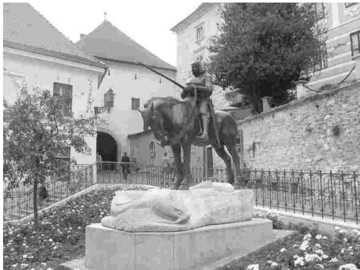
Horvaatia pealinna Zagrebi kaitsjaks on Püha Jüri

Kõige pikemalt olime Horvaatias, külastades sealseid ajaloolisi linnu ja nautides suvelõppu Aadria mere äärsel kaunil Dalmaatsia rannikul. Pula linnas Istra poolsaare lõunatipus on haruldaselt hästi säilinud 1. sajandist pärit võimas amfiteater. Splitis pakkus elamust 3.sajandist pärineva Rooma keisri Diokletianuse paleekompleksis jalutamine, vaatamata isegi sellele, et võimsast ehitisest on selle algkujul väga vähe alles jäänud. Ühe sissepääsu ees seisab 10.sajandil elanud piiskop Grguri ülisuur pronkskuju, kelle varba silitamine pidi selle