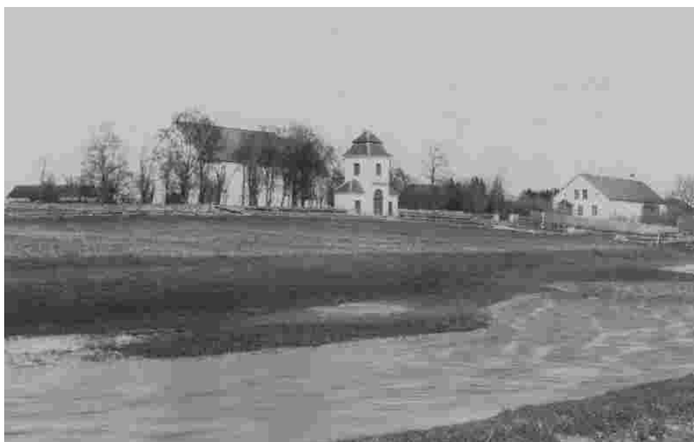
Nii nägid välja Rapla kirik, kellatorn ja pastoraat Halleri ajal 19.sajandil