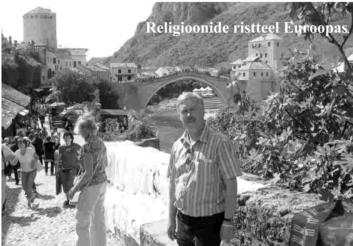
Mostari linn Bosnia ja Hertsegoviinas, keskel 16.sajandist pärit eri rahvusi ja religioone ühendanud ja lahutanud jalakäijate sild

Möödunud aasta septembris viibisin puhkusereisil põneva ajalooa Lääne-Balkanil, kus sajandite jooksul on ida- ja läänekristlus ehk õigeusk ja katoliiklus koos lõunast Euroopasse tunginud islamiga omavahel põrkunud ja põimunud. Lisaks Sloveeniale, Horvaatiale, Bosnia ja Hertsegoviinale ning Montenegrole sain põgusalt tutvuda ka kaua Euroopa suletuimaks riigiks olnud Albaaniaga.