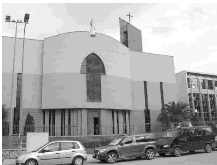
Uhiuus ja moodne Kisha katedraal Tiranas

Kuigi Albaaniat valitses rohkem kui neli sajandit Ootomanide impeerium, oli enne Teist maailmasõda seal moslemeid 70% ning kristlasi 30% rahvastikust. Neist omakorda 20% oli õigeusulisi ja 10% katoliiklasi.