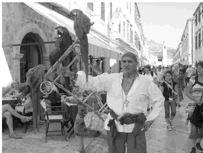
Dubrovniku peatänav, mis on alati rahvarohke