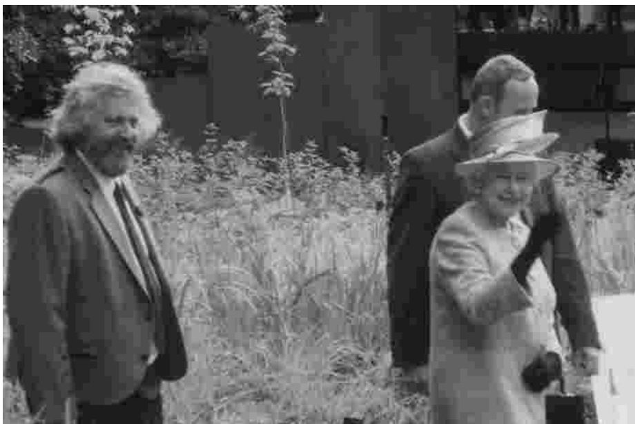
Üllatuskohtumine kuninganna Elisabeth II-ga Edinburghi botaanikaaias

Edinburghi vanalinnas külastasime kahte teineteise vastas üle tee olevat suurt katedraali. Üks oli katoliku, teine šoti episkopaalkirik, mõlemad kõrged ja avarad hooned. Ka Stirlingis veetsime mõnusa puhketunni vanalinna suurimas kirikus mahedat orelimuusikat kuulates. Sealne orel olevat üks Euroopa romantilisema kõlaga pille.