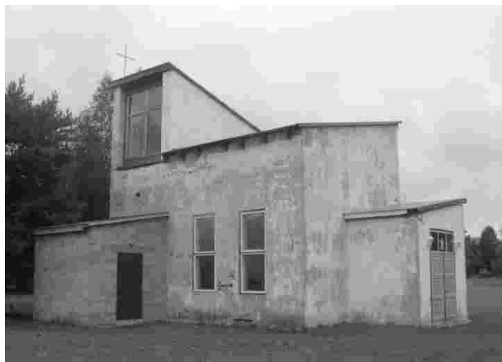
Endine tootmishoone Salmel on muudetud Anseküla koguduse pühakojaks, mida rahvas hellitavalt tursakirikuks kutsub