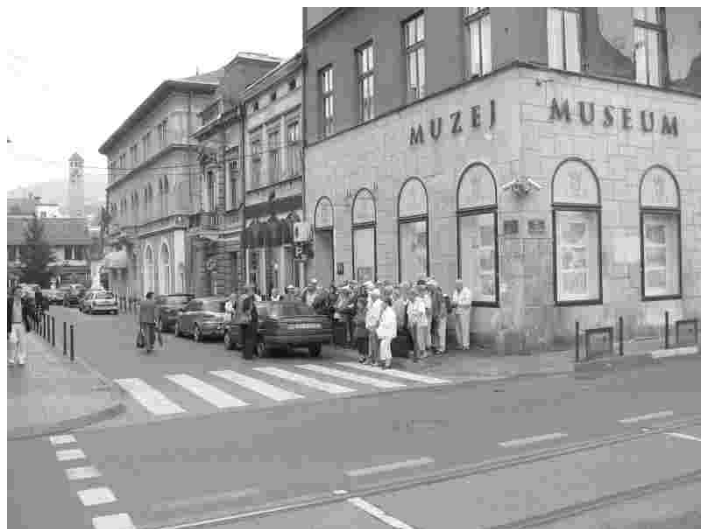
Sellel tänavanurgal Sarajevos mõrvati 28.juunil 1914 Austria-Ungari troonipärija Franz Ferdinand ja tema abikaasa Sofia

Montenegro, mida slaavipäraselt ka Tšernogooriaks kutsutakse ja tähendab tõlkes musta mäge, olevat oma nime saanud merel seilanud itaallastelt, kellele kõrged tammemetsadega kaetud mäed paistnud eemalt musta värvi. Keskajal tunti seda Zeta vüstriigi nime all, mida türklased ei suutnud kunagi vallutada. Oma keele, religiooni ja etnilise päritolu poolest on montenegrolased kõige lähedasemad õigeusuliste serblastele.